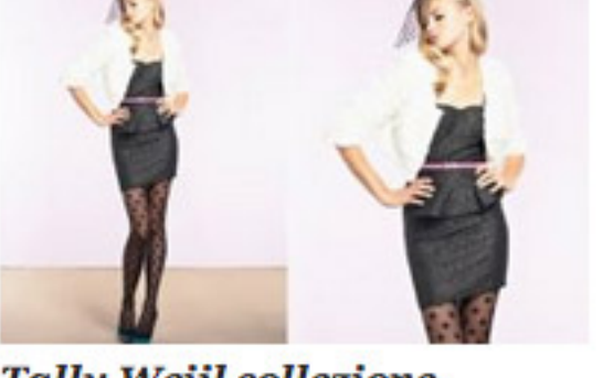
Tally Weijl collezione Autunno/Inverno 2012-2013