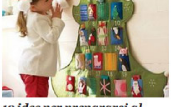
10 idee per prepararsi al Natale coi bimbi