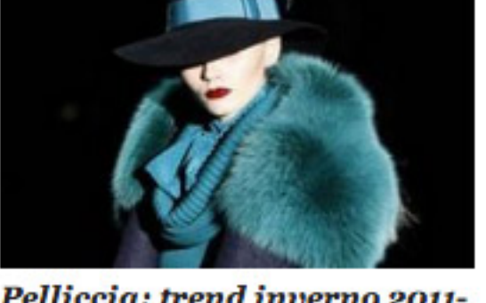
Pelliccia: trend inverno 2011-2012