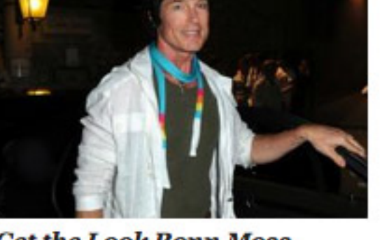
Get the Look Romn Moss