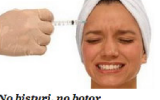
No bisturi, no botox